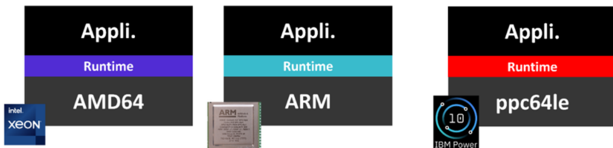
2 Le modèle de la CLR .NET

Afin de s'exécuter sur toutes les plateformes, les applications et modules développés en .NET utilisent des composants disponibles dans une bibliothèque appelée CLR (Common Language Runtime). La CLR contient tous les fondamentaux pour réaliser les différentes opérations et interagir avec le hardware. Chaque architecture dispose de son implémentation de la CLR, ce qui garantit que toutes les applications construites sur ces composants fonctionnent nativement dans ces architectures.